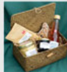
150 pixlar bred