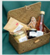
Anpassad bild 450 pixlar bred